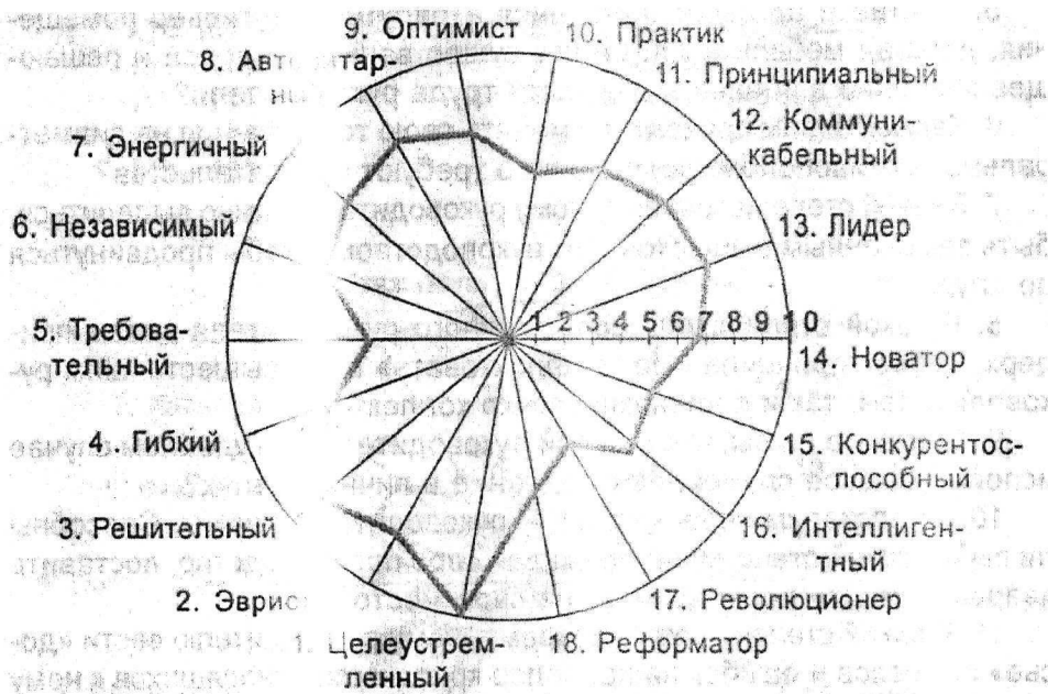
Рис. Построение профиля творческих качеств